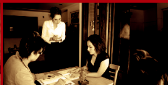
Чакаме дълго до пристигането на сервитьора до масата