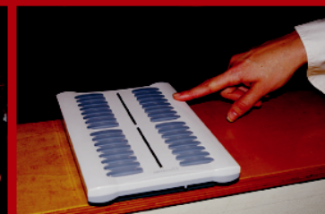
Клиентът натиска повиквателния бутон, когато е готов да поръча