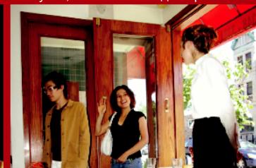
Клиентът излиза доволен и препоръките са на път ...