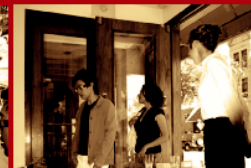
Излизаме недоволни от обслужването