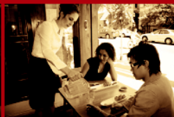
Чакаме дълго време за гарнитура/ десерт