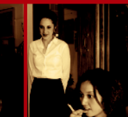
Пречене/ слушане на разговора