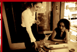
Чакаме дълго време за получаване на сметката