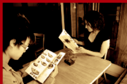
Няма сервитьор наблизно, приемащ поръчка