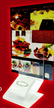
ТС- 100 с масова позиция за меню