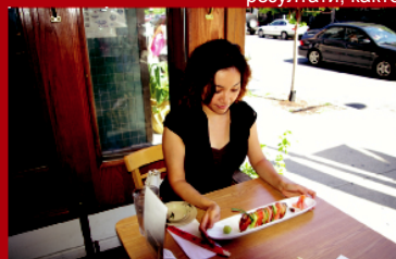
Клиентът е доволен от ястието, необезпокояван от сервитьора