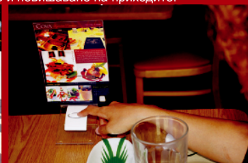
Клиентът е готов за гарнитура/ десерт-натиска бутона