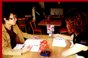
Сервитьорът идентифицира масата и вида на повикването